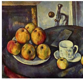
Nature morte aux pommes et à la trompette , Paul Cézanne, 1894.

Georges Braque, plafond peint au musée du Louvre, 1961.