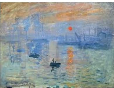
Impression soleil levant , Claude Monet, 1874

Les œuvres sont choisies en fonction des différents mouvements picturaux auxquels elles appartiennent. Elles proposent donc différentes caractéristiques que l'enfant choisira ou non de représenter. Nous avons fait le choix d'éviter toutes difficultés liées à la représentation de la perspective par exemple ou à des soucis de réalisation de multiples détails trop complexes (les tableaux proposent en effet que peu d'éléments à représenter).