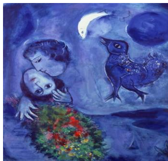
Paysage bleu , Marc Chagall, 1949.