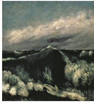
La vague , Gustave Courbet, 1870.