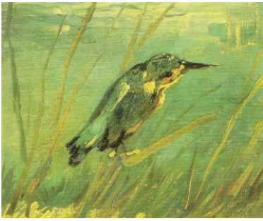
Martin Pêcheur , Vincent Van Gogh, 1886.