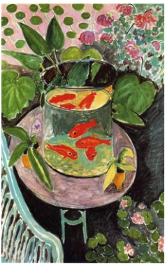
Goldfish , Henri Matisse, 1911.